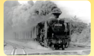
※蒸気機関車(国鉄二俣線時代)

天浜線「天竜二俣駅」には、可動する転車台、扇形車庫が現存しており、全国的にみても貴重な鉄道の歴史遺産となっております。