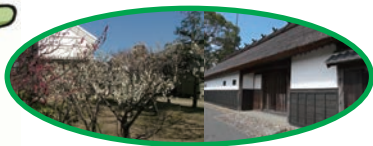
黒田家代官屋敷（当日は梅まつり開催中）