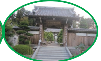
好運寺にて「寺カフェ」