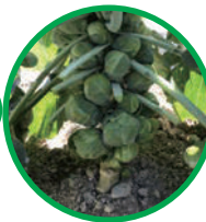
芽キャベツ & プチヴェールの収穫体験 ◆協力 株式会社つきの丘