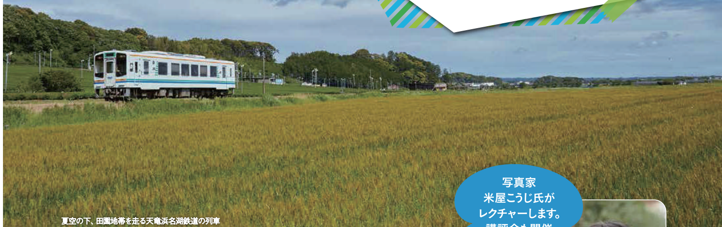
夏空の下、田園地帯を走る天竜浜名湖鉄道の列車