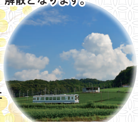
※写真・イラストは全てイメージです。