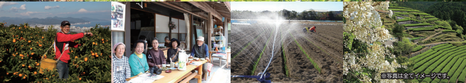
※写真は全てイメージです。

対象者 移住・就農に興味があり静岡県外にお住まいの 全行程にご参加いただける20歳以上の方