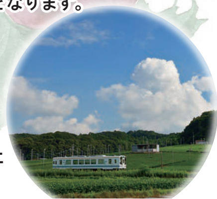
※写真・イラストは全てイメージです。