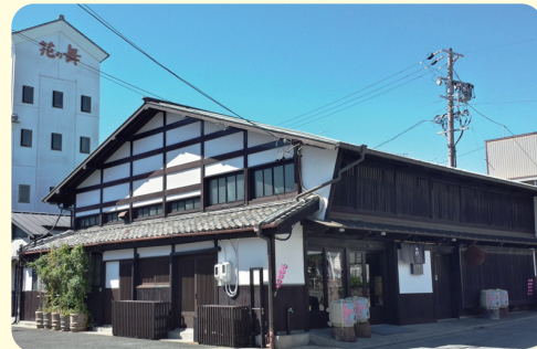
※写真・イラストは全てイメージです。

一千年を超える試行錯誤の歴史を経て、世界に比類のない醸造法を確立した日本酒造り。この先人たちの築きあげた技術と精神を基本としながら新しい技術の導入も計り伝統だけに捉われないことのない新たな日本酒の価値を創出します。