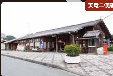
昭和15年(1940年)に建造され、 長年使い込まれた施設一式は地域遺産である。